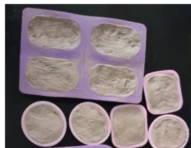
Gambar 3. Pencetakan sabun

larut, kemudian dinginkan hingga suhu 37°C (suhu kamar). Campurkan minyak kelapa sawit sebanyak 300 gram, minyak zaitun sebanyak 300 gram, minyak VCO sebanyak 300 gram ke dalam gelas ukur dengan ukuran 1000 ml, kemudian masukkan NaOH dengan suhu 37°C (suhu ruangan) ke dalam gelas ukur yang berisi minyak kelapa sawit, minyak zaitun dan VCO. Tambahkan bubuk kopi dan minyak atsiri. Setelah itu, aduk semua bahan tersebut dengan menggunakan stik blender hingga terbentuk trace (kondisi campuran yang mengental). Setelah itu, masukkan campuran sabun tersebut ke dalam cetakan sabun lalu ratakan.