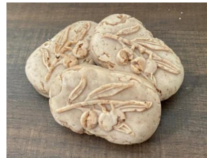
Gambar 8. Tekstur Sabun

Sabun padat harus memperhatikan tekstur yang dihasilkan. Sabun mendapatkan tekstur yang baik dan menampakkan khas kopi yang terdapat serbuk bubuk kopi pada permukaan teksturnya yang bermanfaat untuk memberikan sensasi halus saat digunakan.