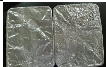
Gambar 4. Penyimpanan sabun

Setelah itu tutup cetakan sabun menggunakan aluminium foil. Tunggu adonan sabun mengeras kurang lebih selama 2 minggu.