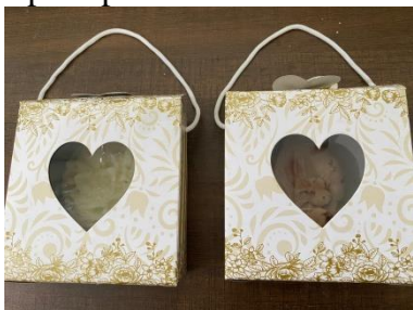
Gambar 9. Kemasan produk

Pada proses pengemasan ini bertujuan agar produk terjaga kebersihannya dan terhindar dari kotoran, serta menambah keindahan dan nilai jual pada produk tersebut