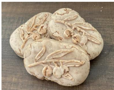
Gambar 5. Hasil produk