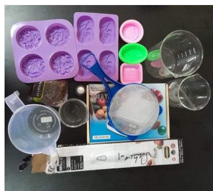
Gambar 1. Alat bahan

Peralatan yang digunakan mencakup timbangan digital, gelas ukur 1000 ml, sendok, stik blender, gelas kimia 4 buah ( 1 buah ukuran 1000 ml, 2 buah ukuran 500 ml, 1 buah 50 ml), cetakan sabun silikon, spatula, baki, batang pengaduk, dan handscone.